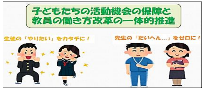
【部活動の地域移行の目的（苫小牧市）】